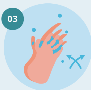
03 Palma com palma com os dedos entrelaçados