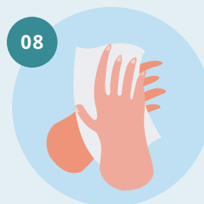
08 Seque as mãos com um toalhete descartável