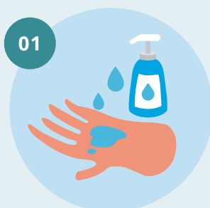
01 Aplique sabão suficiente para cobrir todas as superfícies das mãos