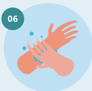
06 Esfregue o pulso esquerdo com a mão direita e vice versa