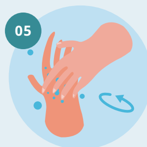
05 Esfregue rotativamente para trás e para a frente os dedos da mão direita na palma da mão esquerda e vice versa