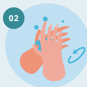
02 Esfregue as palmas das mãos, uma na outra